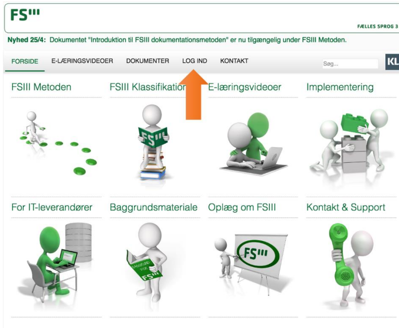
Figur 3 - Login