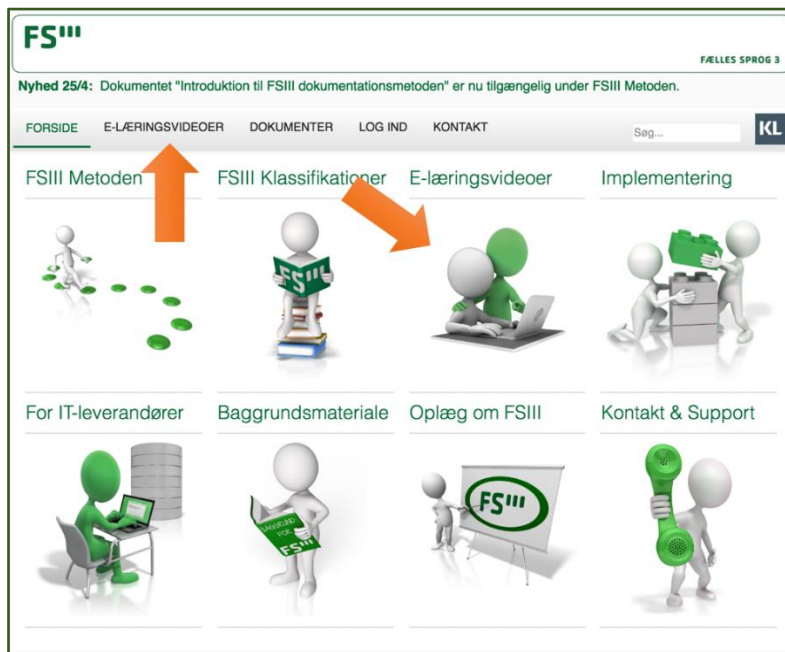
Figur 1 - Illustration af hvor e-læringsmaterialet tilgås via hjemmesiden www.fs3.nu.

På fs3.nu tilgås e-læringsvideoer enten i menuen øverst eller ved at trykke på E-læringsvideoer i hovedmenuen. Se Figur 1.