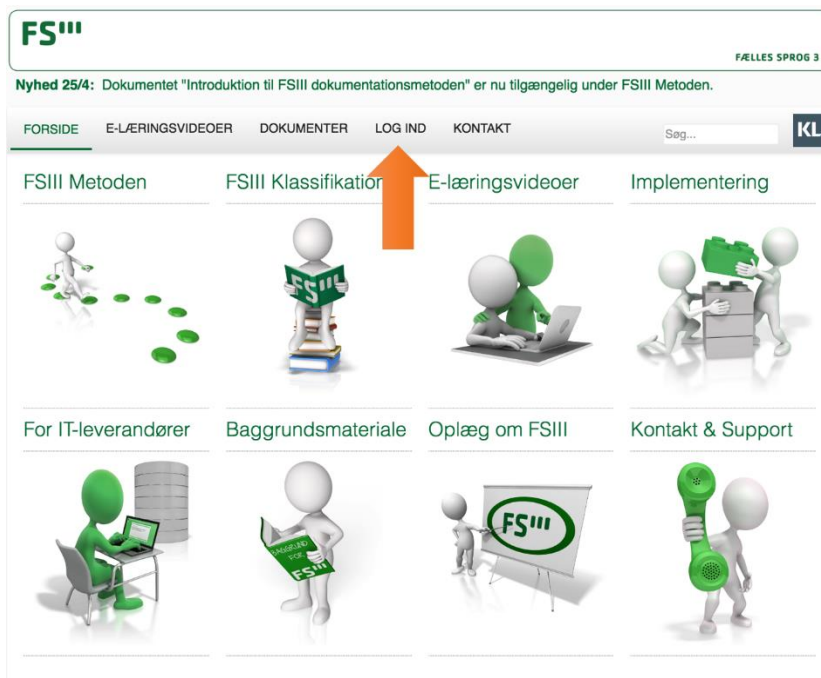
Figur 3 - Login